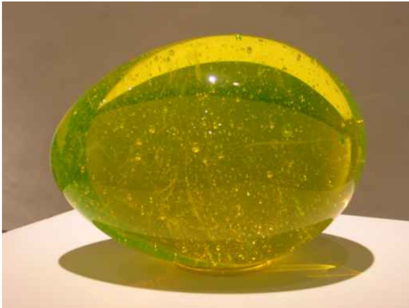
Ján Zoriäk. Elusaladus. 1969