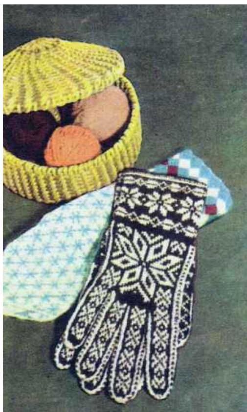
Koondise “Uku” rahvakunstimeistrite poolt valmistatud kindad. Nõukogude Naine. 1969